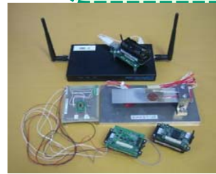
MOTE Zigbee センサーネット