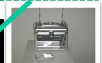
持運びに便利な バッテリー 付き携帯ケース